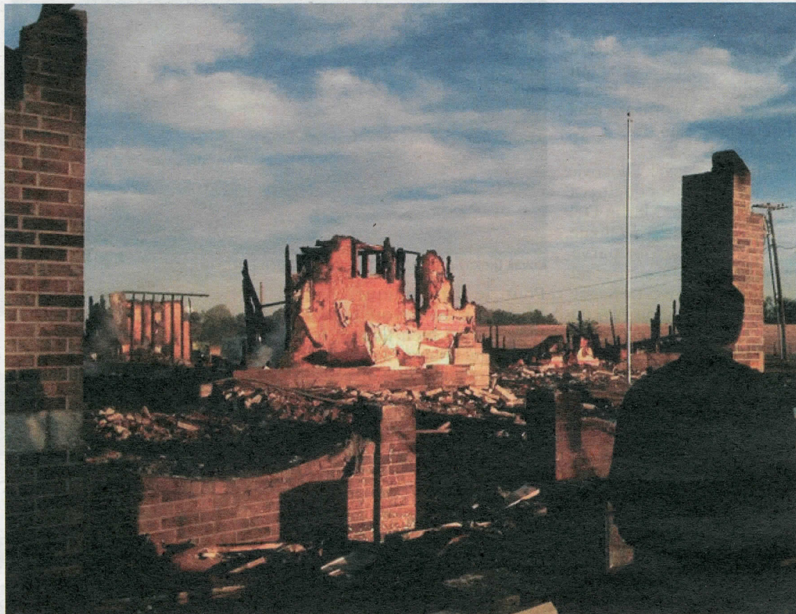
Ce qui reste du bâtiment de la mosquée de Joplin ravagée par un incendie d'origine criminel.