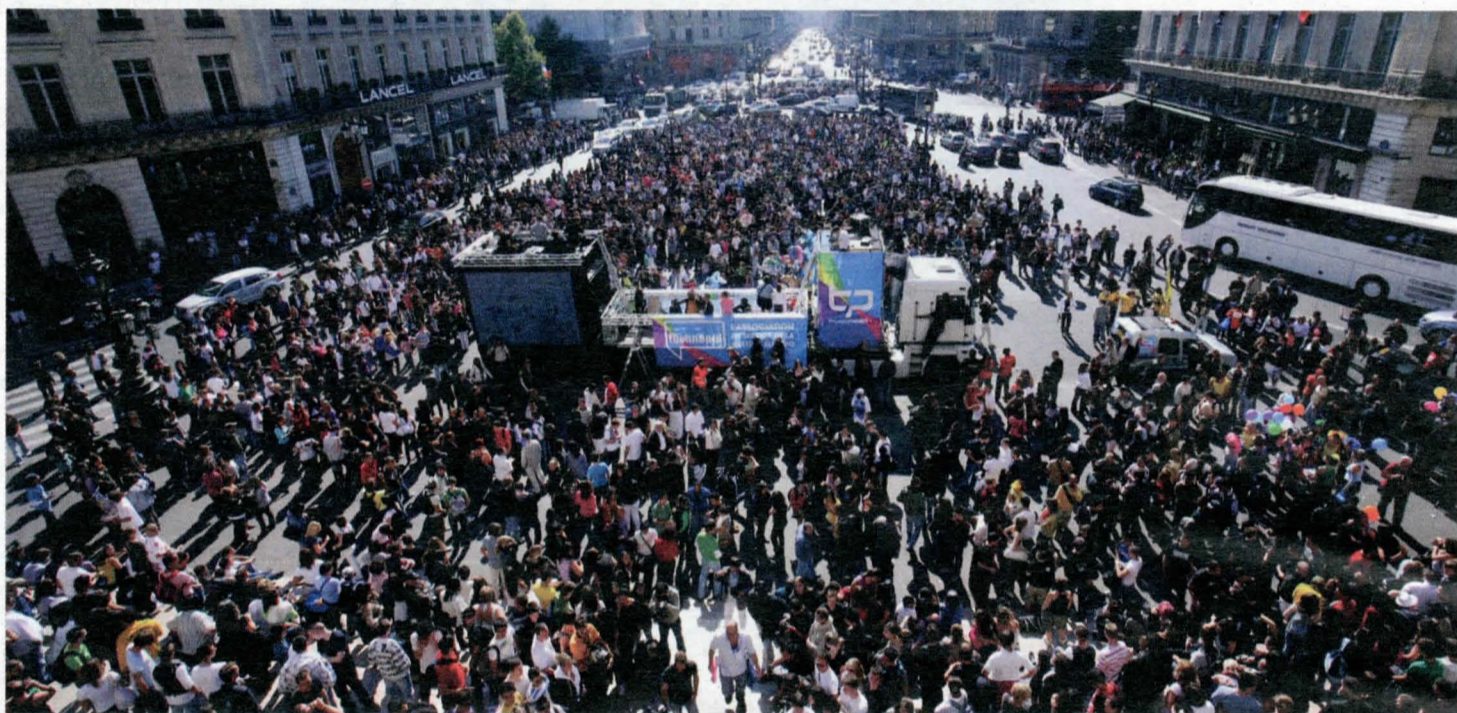
La Techno Parade 2012 a choisi le Maroc comme invité d'honneur de la 14 e édition qui se tiendra ce samedi à Paris.

La Techno Parade connaît un engouement populaire impressionnant en rassemblant une foule de plus de 400 000 participants à travers les grands boulevards parisiens. C'est le deuxième plus grand évènement consacré à la musique après la fête de la musique. DJ marocains, à vos platines ! ♦