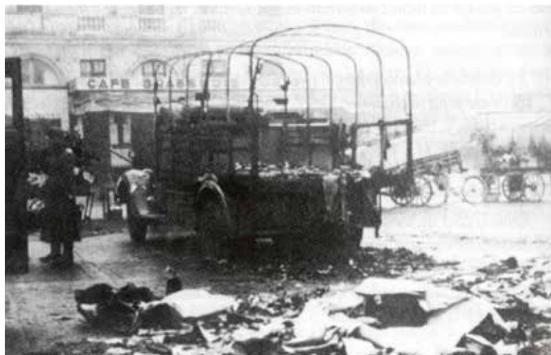
Opération contre les troupes d'occupation, place du Capitole en 1944

(à convenir par mail elerika@wanadoo.fr )