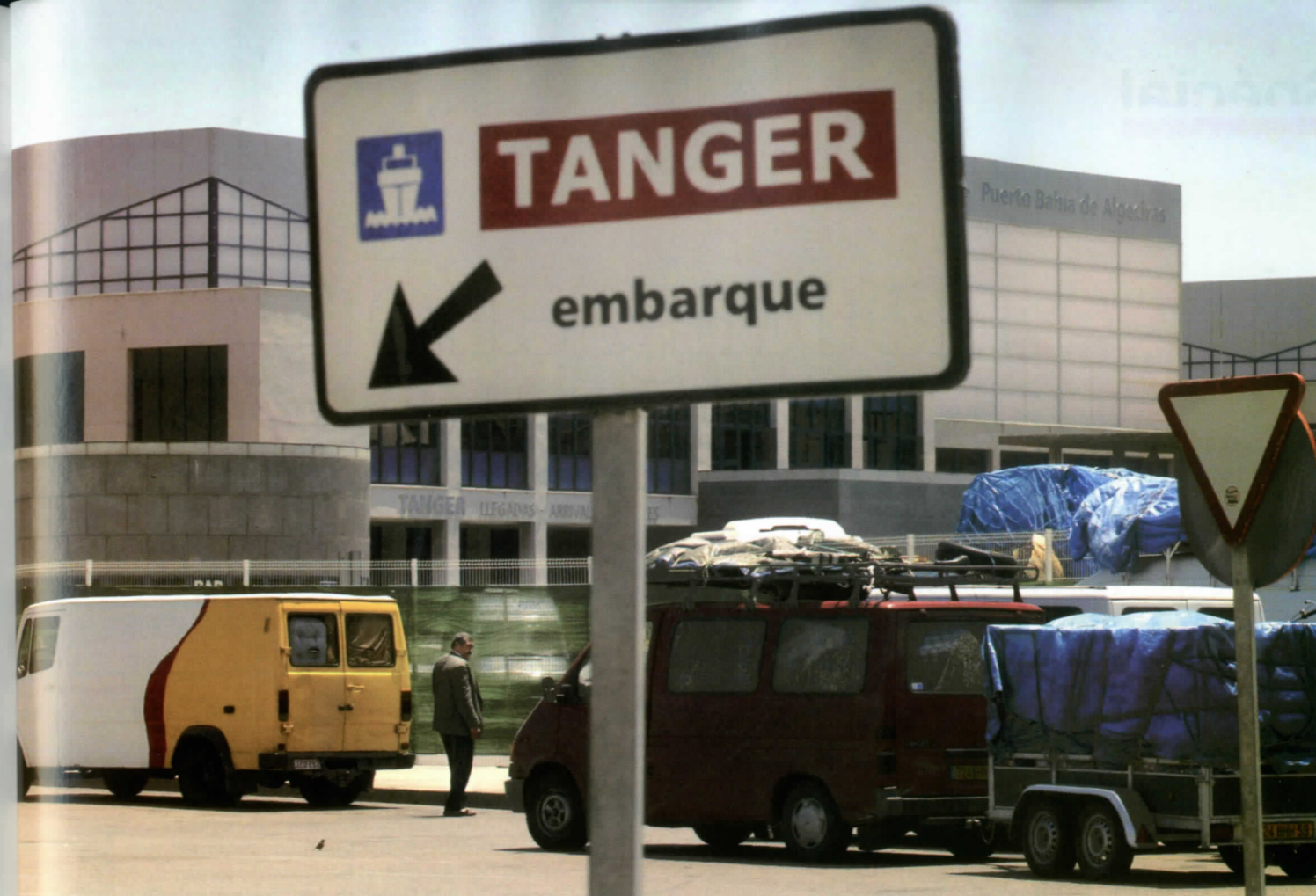
Longtemps « abandonnée » à son propre sort, la communauté des Marocains du Monde se voit de plus en plus « cajolée », depuis ces dernières années.

Au niveau individuel, selon l'étude réalisée par l'Observatoire de la Fondation Hassan II, les transferts de fonds MRE sont affectés, en moyenne, à hauteur de : 70 % à la consommation des ménages, 20 % aux dépôts bancaires, 6 % à l'investissement, et 4 % comme participations à des actions collectives. La part orientée vers l'investissement est consacrée à concurrence de 85 % à l'immobilier. Une autre forme de répartition conclut à la répartition suivante des transferts : 45 % pour l'aide familiale, 41 % pour l'investissement immobilier, et 14 % pour l'investissement productif. L'écrasante part des transferts sert à couvrir les besoins courants de consommation de la famille restée au pays et contribue directement à l'amélioration des condi-