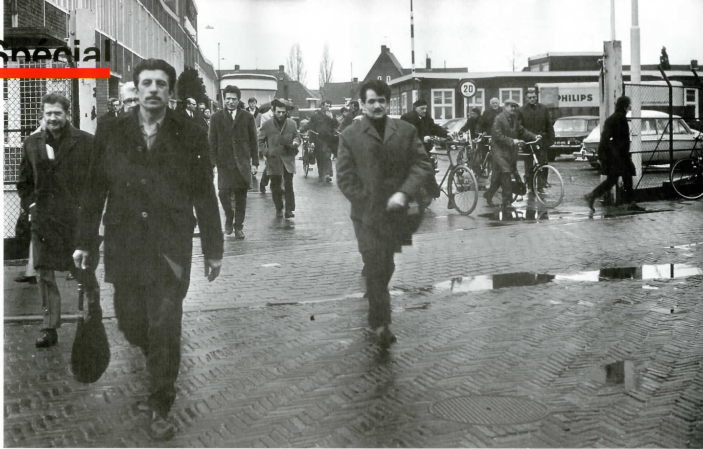
Travailleurs immigrés à la sortie d'usine chez Philips, dans les années 1970.