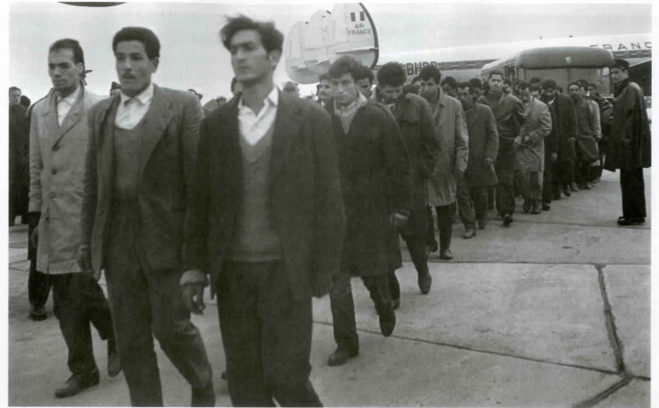
Depuis le fin des années 1980, le France perd son «prestige» de première destination européenne des travailleurs maghrébins.

constater qu'on a longuement donné l'impression que la venue des migrants était un phénomène temporaire ; mais peu à peu, on a accepté officiellement que leur séjour soit du provisoire qui dure et que les Pays-Bas deviennent un pays d'immigration. Sur le plan régional / local au Maroc, le processus de la migration a certainement contribué à un soulagement de la pression démographique ; environ 45% des douars dans les régions d'origines vivent presque uniquement de la migration et à peu près un tiers vit de double sources ; production locale plus migration. [...] En somme, il n'est pas du tout facile de dresser le bilan des profits et des pertes du processus migratoire, d'estimer les avantages et les inconvénients. Il va sans dire qu'on peut observer nombre de transformations dans les douars concernés et c'est l'émigration qui provoque certains aspects, du moins, elle les accentue. ■