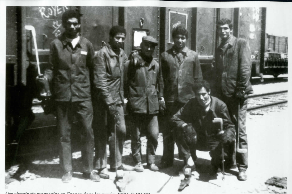
Des cheminots marocains en France dans les années 1970.

L'intégration des deuxième, troisième et quatrième générations est une vraie réussite notamment dans le domaine de la politique. La Belgique étant parmi les pays européens qui ont accordé le droit de vote aux étrangers depuis les élections de 2004. Le gouvernement actuel d'ailleurs compte deux personnes originaires du royaume. ■