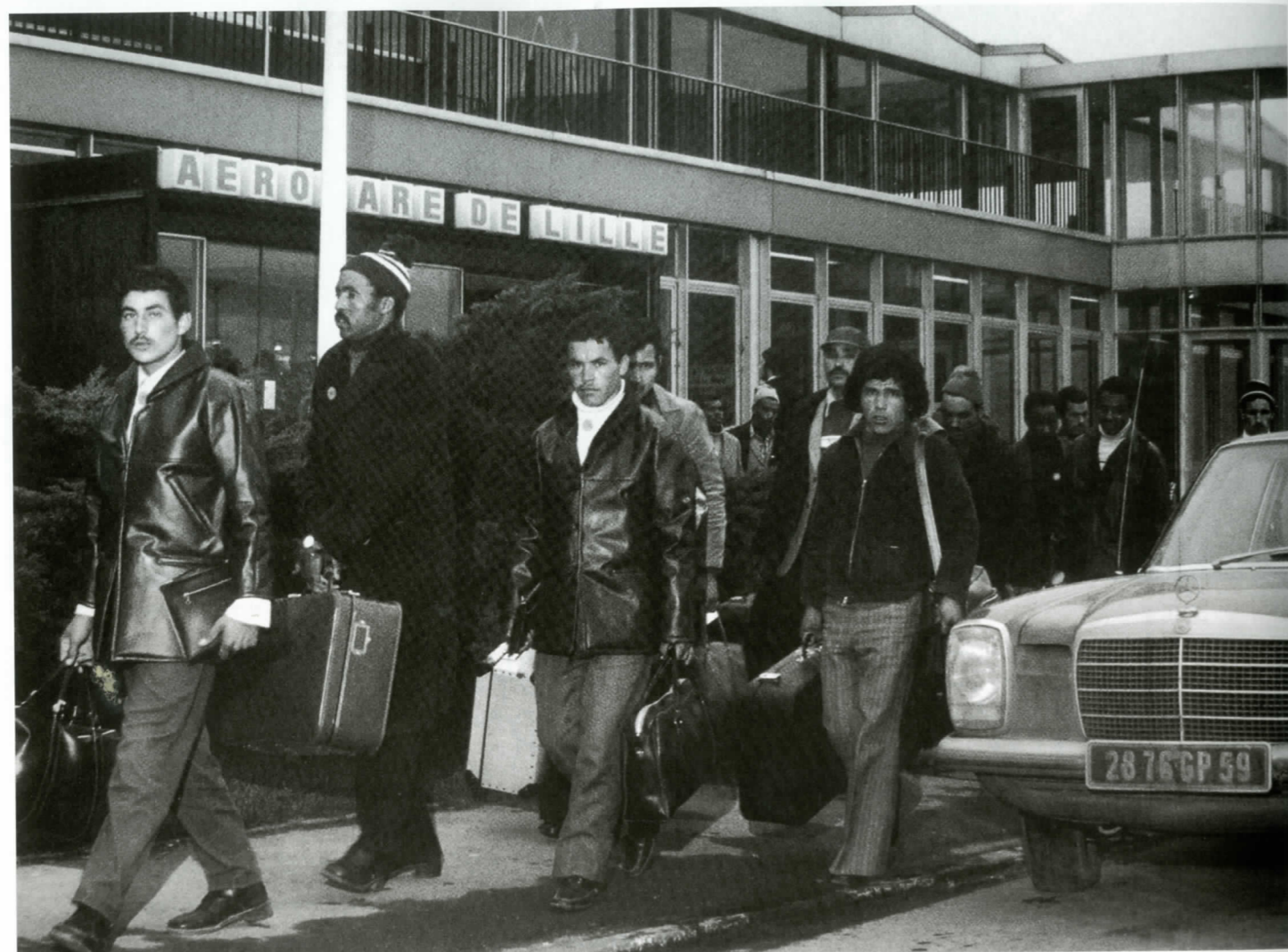
Les Marocains sont arrivés dans le Nord-Pas-de-Calais dès les années 70 et y sont plus nombreux depuis le milieu des années 2000.