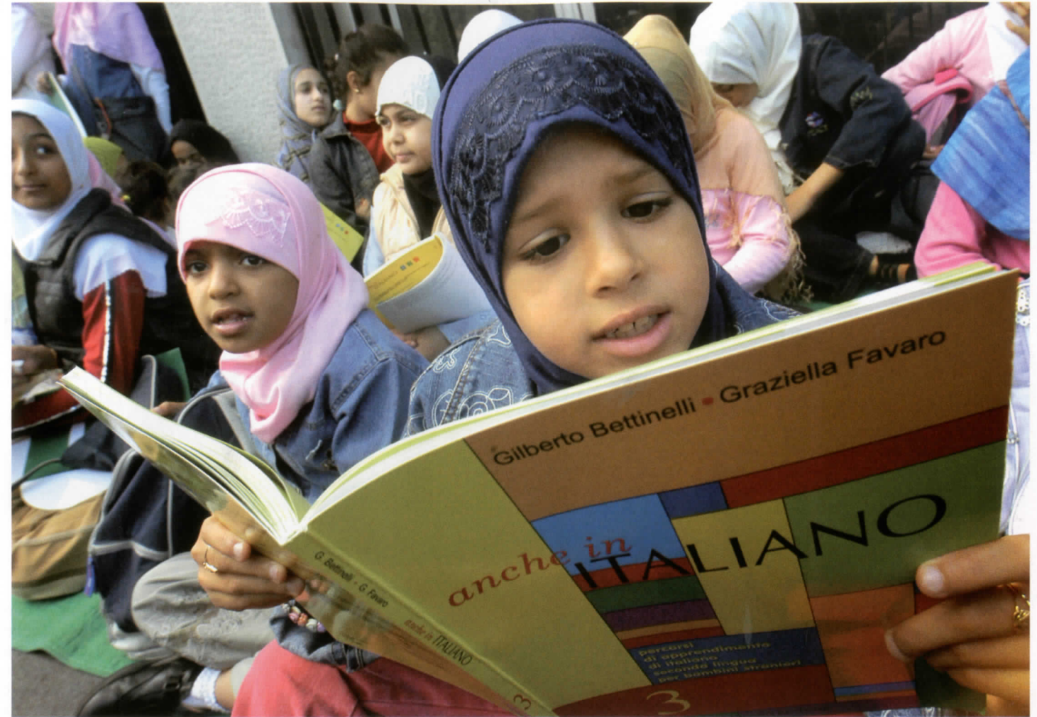
Les enfants de la nouvelle génération des immigrants maghrébins d'Italie.

La régularisation d'une partie des immigrants marocains en Italie, en 1986, n'a pas eu de conséquences