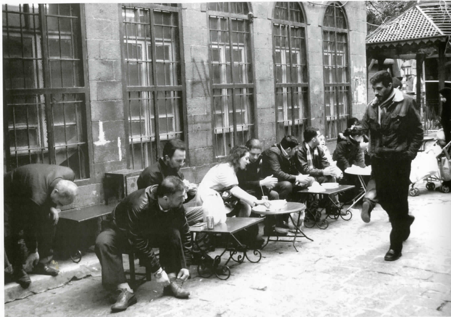
Des immigrants étrangers dans la capitale espagnole, Madrid.