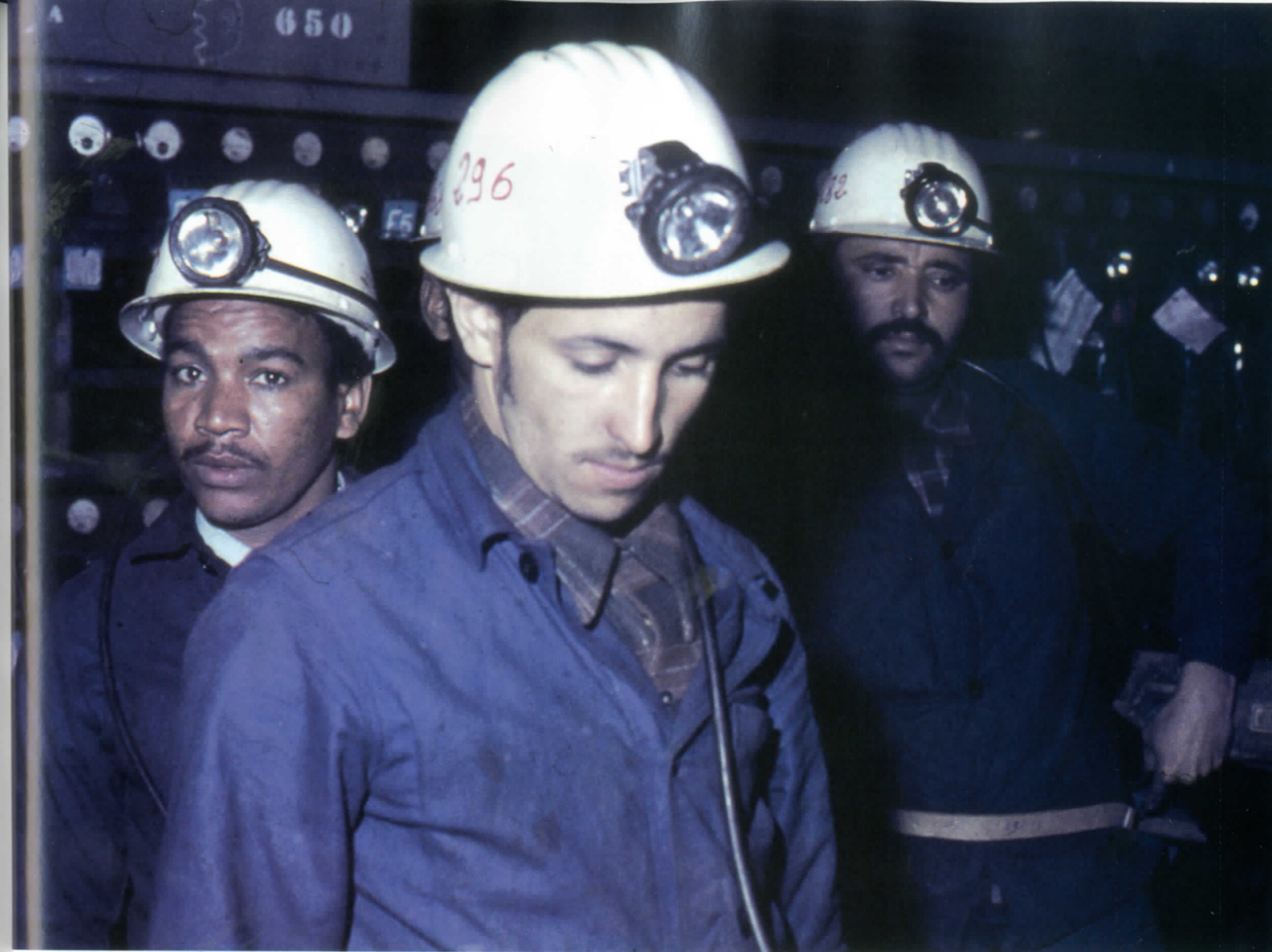
Dès les années 1950, des Marocains des régions du sud sont recrutés, puis « transférés » pour travailler dans les mines en France.

Une autre catégorie d'immigration vers la France, moins importante, consiste en l'arrivée d'étudiants, mais également d'opposants au régime de Hassan II.