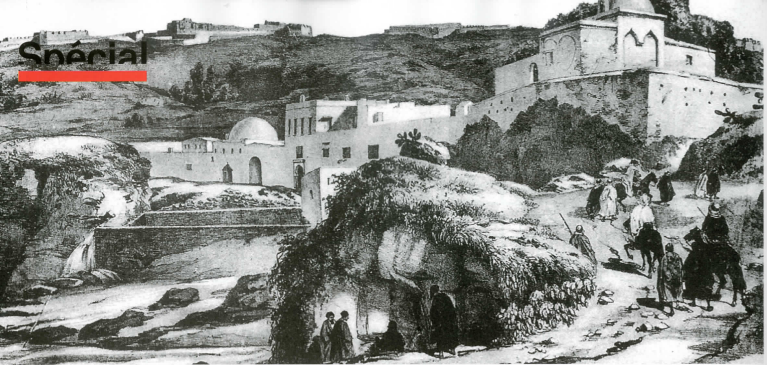
Dar al-Baroud dans le vieil Alger, vers la fin du XIX e siècle.