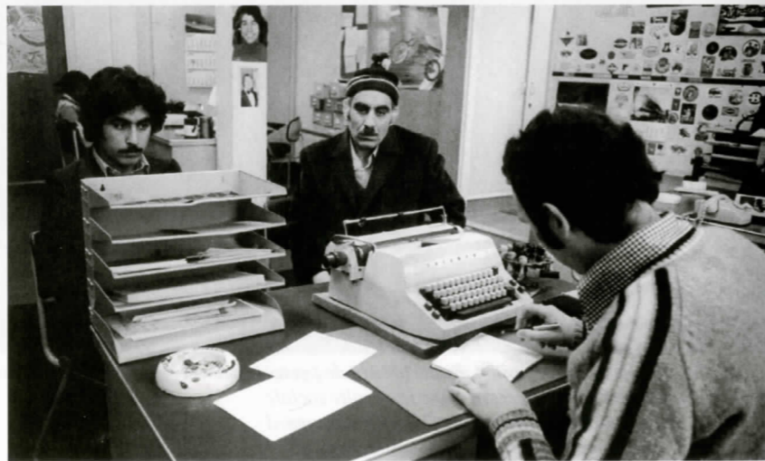
Un bureau des services de la police d'immigration hollandaise en 1978.

Peu à peu, l'État a accepté officiellement que le séjour des immigrés soit du provisoire qui dure et que les Pays-Bas deviennent un pays d'immigration