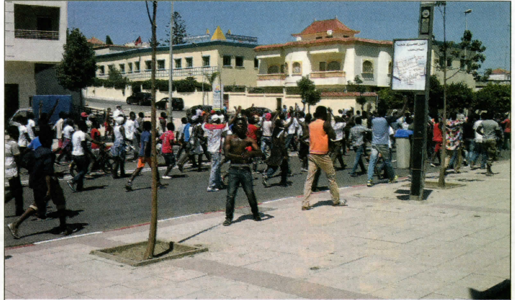
Une centaine de migrants subsahariens en colère ont participé à une marche de protestation pour réclamer la dépouille d'un ressortissant sénégalais, décédé vendredi soir. La tension a baissé d'un cran à Al Irfane, mais l'ambiance reste électrique

En effet, la journée du vendredi 29 août restera gravée dans les esprits, au quartier Al Irfane. Ce jour-là, l'inévitable est arrivé, après plusieurs mois d'affrontements, de tensions et même de violences entre Marocains et migrants clandestins. Ces confrontations se sont soldées par le décès d'un Sénégalais suite à des blessures au cou. Cette agression a eu lieu après une banale rixe vendredi soir entre Subsahariens et Marocains dans l'une des nombreuses échoppes que compte le quartier. Selon des témoins sur place, les affrontements ont commencé par des jets de pierres avant le recours aux armes blanches. A un moment, la tension s'est accentuée et le drame est vite arrivé. Une enquête est aussitôt lancée par le parquet