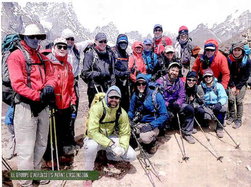
LE GROUPE D'ALPINISTES AVANT L'ASCENSION.