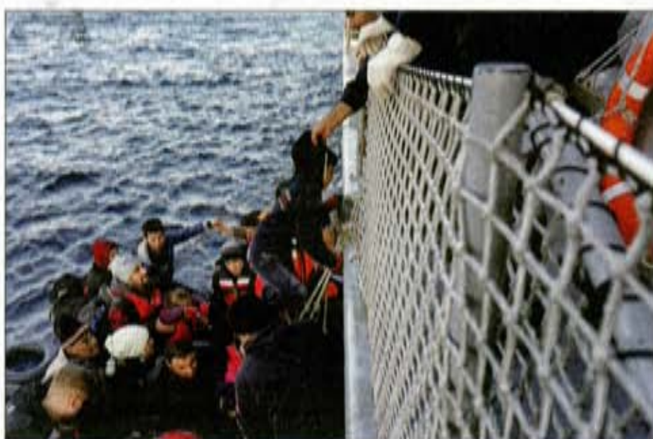
Les responsables marocains et allemands devront procéder, durant 45 jours, à l'identification des migrants séjournant de façon illégale en Allemagne. L'objectif est de s'assurer qu'ils sont Marocains. Plusieurs clandestins se réclament souvent d'une nationalité qui n'est pas la leur

Le Souverain et la Chancelière allemande avaient convenu de renforcer la coordination entre les responsables des deux pays pour l'examen des dossiers concernés. Le Maroc, qui a toujours refusé d'être le dépotoir des clandestins refoulés par l'Europe, exige l'identification des clandestins comme étant Marocains. Surtout que beaucoup de personnes en situation illégale en Europe se présentent