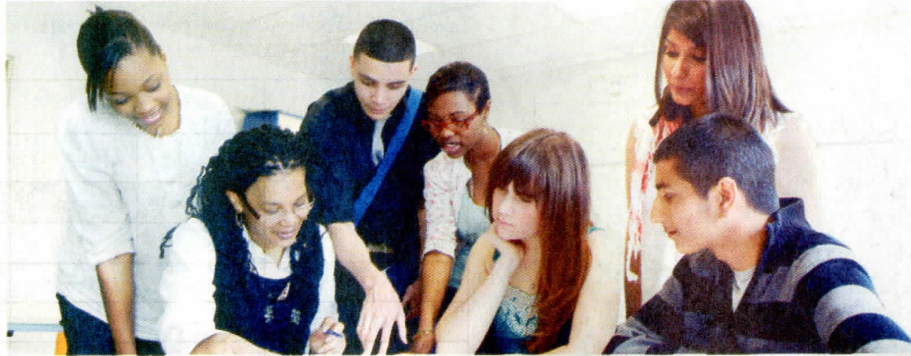
Les jeunes constituent un atout indéniable pour réussir les grands projets de développement lancés au Maroc.