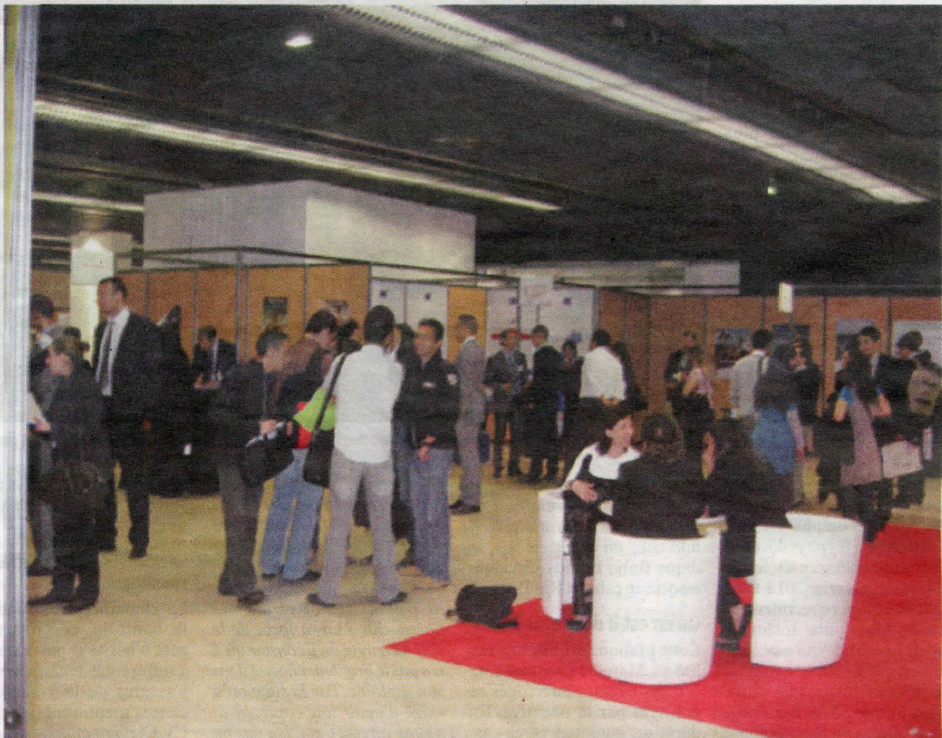
Les Forums organisés par le réseau Careers in Morocco s'adressent principalement aux étudiants et professionnels marocains expatriés

Il y a des secteurs qui reviennent souvent tels que le secteur des Banques, de la finance, des télécoms et des nouvelles technologies Banque, Finance, télécom, les nouvelles technologies. Mais au cours des deux dernières années, nous constatons surtout un nombre très important de candidats qui s'orientent de plus en plus vers les nouveaux métiers tels que l'industrie solaire, ferroviaire en alignement avec les besoins