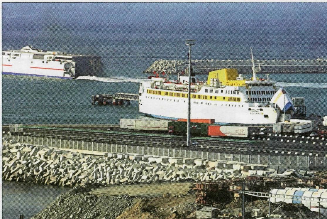
Les nouvelles installations du port TangerMed ont permis de fluidifier encore plus l'opération transit. Cette année, plus de 2,5 millions de MRE sont attendus. L'objectif aujourd'hui est de rendre les délais d'attente plus courts et la traversée moins pénible

E T de deux ! Le port roulier TangerMed est sur le point d'entamer une de ses plus lourdes tâches pour la seconde année consécutive, l'opération transit. Le port a réussi son pari en 2010 et semble disposé à faire de même cette année.