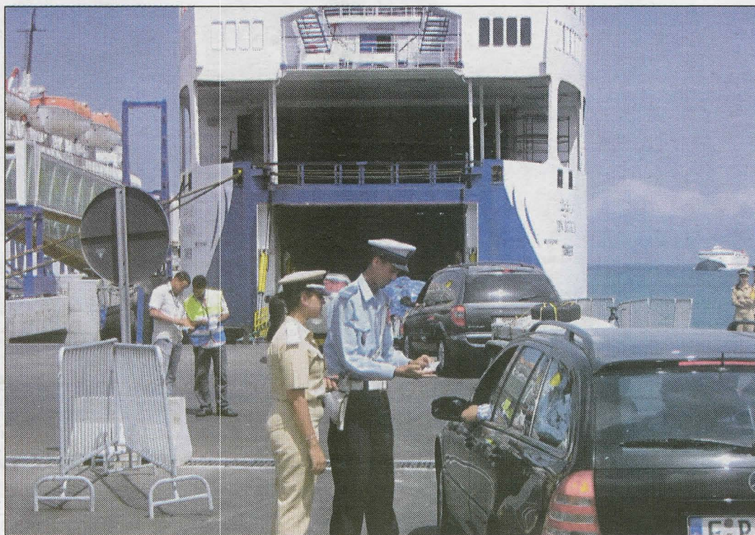
La durée de la traversée du détroit de Gibraltar a été sensiblement réduite. La mise en service de navettes rapides entre le Maroc et l'Espagne est vraiment appréciée par les MRE

SI les hirondelles annoncent le printemps, les MRE annoncent l'été. Déjà, l'on commence à voir sur les routes et aires d'autoroutes des compatriotes en provenance d'Italie, d'Espagne... Mais le rush est attendu pour fin juin et début juillet. D'habitude, l'opération Transit, destinée à assurer dans les meilleures conditions l'arrivée des Marocains résidant à l'étranger, démarre mi-juin. Cette