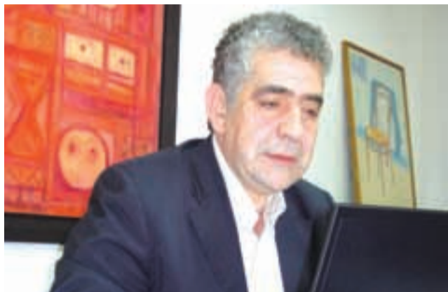
Driss El Yazami, président du Conseil de la Communauté marocaine à l'Étranger (CCME).

DÉBAT. La recherche en histoire de l'émigration marocaine est une nécessité, a affirmé le président du Conseil de la Communauté marocaine à l'Étranger (CCME), Driss El Yazami. Une enveloppe budgétaire sera réservée à la recherche scientifique sur l'émigration marocaine, a-t-il dit lors d'un séminaire organisé lundi à Mohammedia sur le thème : "Histoire et mémoires vivantes de l'émigration".