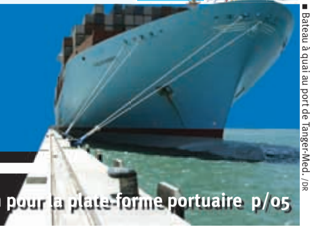
■ Bateau à quai au port de Tanger-Med.

Journal Quotidien d'Information Générale. Edition du mercredi 28 janvier 2009 • n°442 • www.aufaitmaroc.com